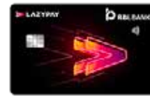
લેઝીપે વાર્ષિક ફી શૂન્ય