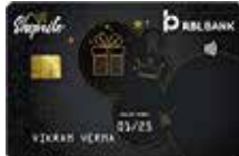
શોપરાઈટ વાર્ષિક ફી રૂ. 500