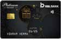
પ્લેટિનમ ડિલાઈટ વાર્ષિક ફી રૂ. 1000