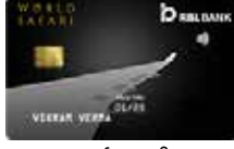
વર્લ્ડ સફારી વાર્ષિક ફી રૂ. 3000