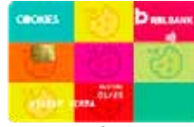
ફૂકીઝ માસિક ફી રૂ. 100