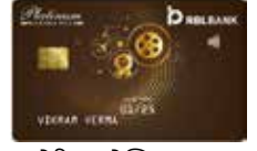
પ્લેટિનમ મેક્સિમા પ્લસ વાર્ષિક ફી રૂ. 2500