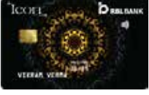
આઈકોન વાર્ષિક ફી રૂ. 5000