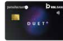
પૈસાબજાર ડ્યુએટ પ્લસ વાર્ષિક ફી રૂ. 1499