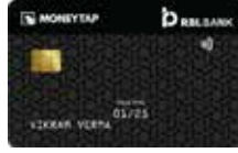
मनीटॅप वार्षिक फी ₹ 499