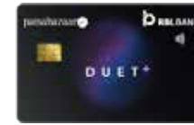
पैसाबाजार ड्युअट प्लस वार्षिक फी ₹ 1499