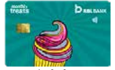
मंथली ट्रीट्स मासिक फी ₹ 75