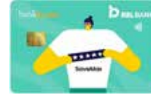
बँकबाजार सेवमॅक्स वार्षिक फी शून्य