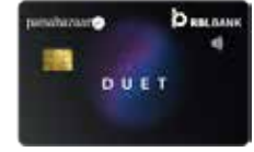
पैसाबाजार ड्युअट वार्षिक फी शून्य