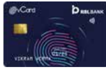
वीकार्ड वार्षिक फी ₹ 500