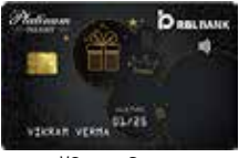
प्लॅटिनम डिलाइट वार्षिक फी ₹ 1000