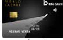
वर्ल्ड सफारी वार्षिक फी ₹ 3000