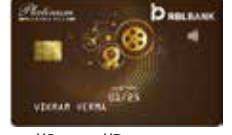
प्लॅटिनम मॅकिजमा प्लस वार्षिक फी ₹ 2500