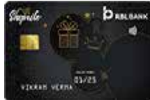
शॉपराइट वार्षिक फी ₹ 500